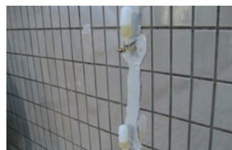
11. 注入材の硬化養生