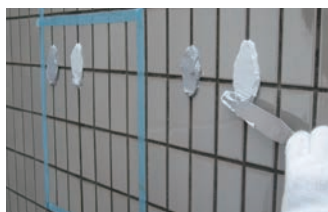
1. 仮止めシール材の選定確認

グラウトパック®-2 は、コンクリート構造物のひび割れ補修専用の無溶剤・ノンブリードタイプの 2 成分形仮止めシール材です。