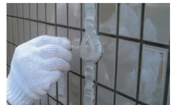
8. グラウトプラグの圧着