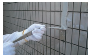
12. プラグと仮止めシール材の撤去