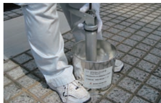
6. コーキングガンへの吸い込み