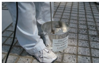
5. グラウトパック®-2の攪拌