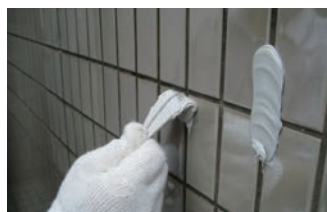
2. 剥離・接着性の事前確認