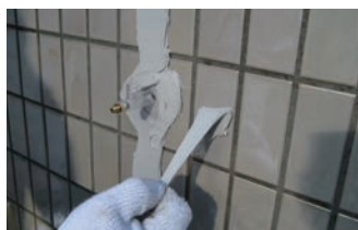
9. 仮止めシール材の養生と硬化確認