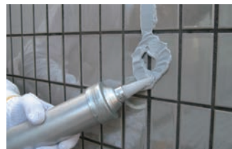
7. 仮止めシールの施工